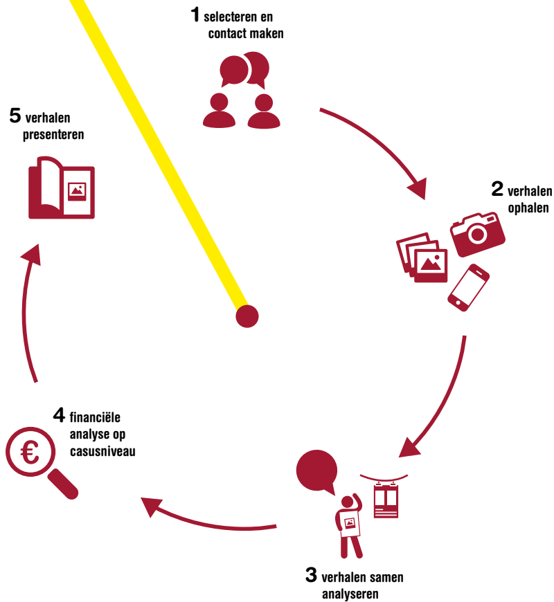
Figuur 1. De methode van het onderzoek in vijf stappen.

W e presenteren de verhalen van de vijf jongeren en drie betrokken coaches die hebben deelgenomen aan dit onderzoek in het volgende deel in willekeurige volgorde. De verhalen worden ondersteund door foto's, quotes en de kosten-batenanalyse op casusniveau zodat een zo compleet mogelijk beeld wordt geschetst. De verantwoording over de onderzoeksmethode voor het ophalen van de verhalen en de kosten-batenanalyse vind je op pagina 30. Tussen de verhalen door vind je enkele inzichten die uit de verhalen zijn voortgekomen. We sluiten af met de overkoepelende inzichten voortkomend uit de verhalen en de kosten-batenanalyse. Tot slot kun je op pagina 35 meer lezen over Kennisland en Ecorys, die dit onderzoek hebben uitgevoerd.