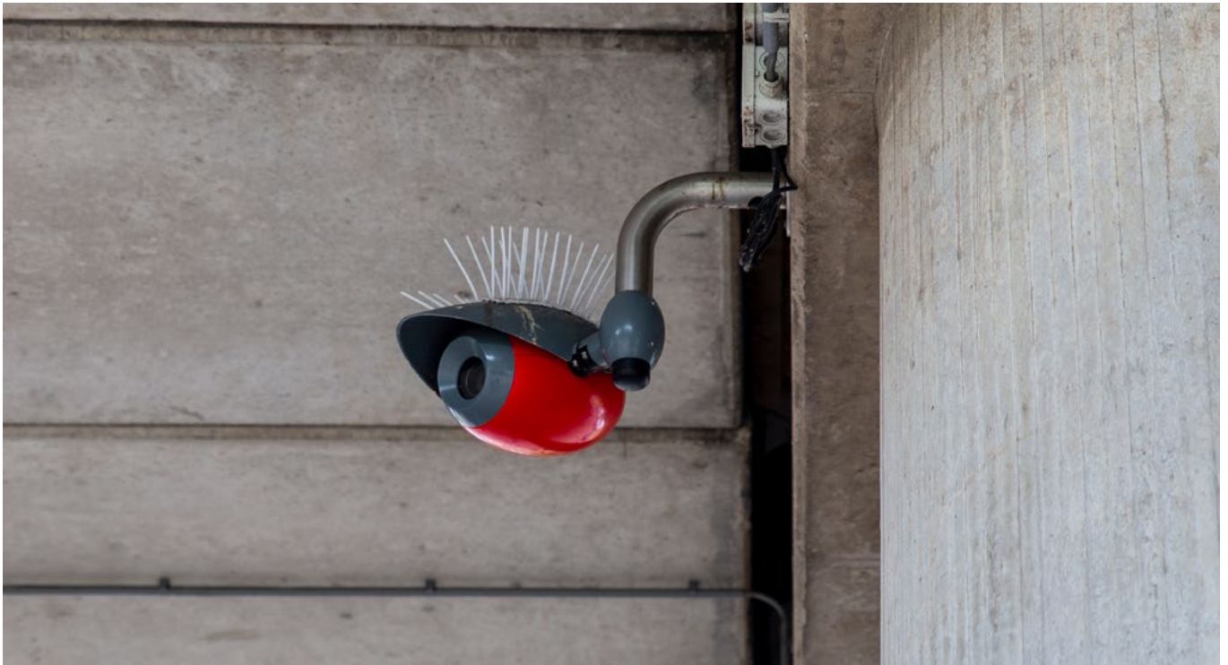
De wijk in Zoetermeer waar hij woont hangt vol met beveiligingscamera's.